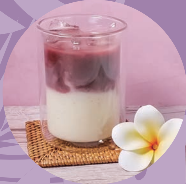
アサイー&バナナヨーグルト