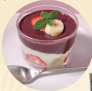
いちごとバナナの ヨーグルトカップデザート