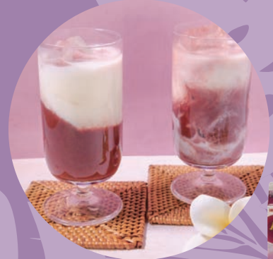
アサイーラッシー