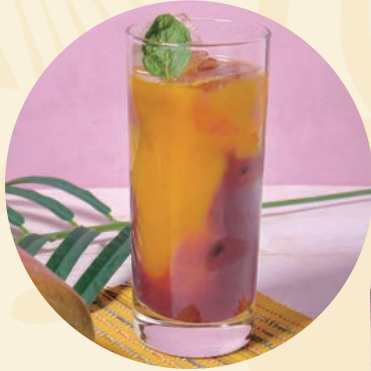
アサイー&マンゴドリンク