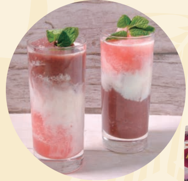
アサイー&グアバスムージー